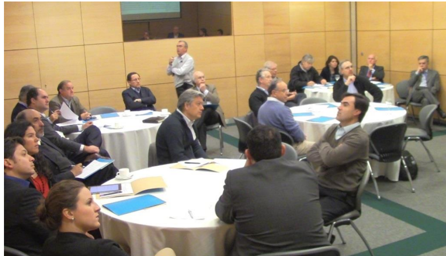
ICARE - Seminario “Confianza” - Mayo 2015