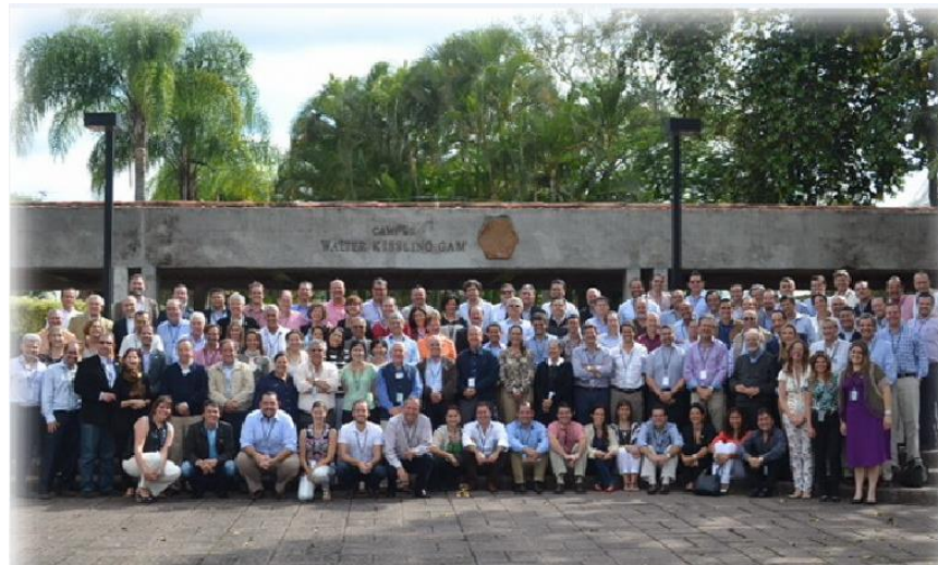
INCAE BUSINESS SCHOOL - San José, Costa Rica (2013)