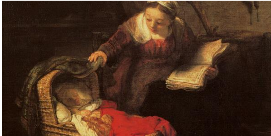
Ave María, Guionod.

Si necesitamos que Cristo vuelva a nacer en este cambio de época, vuelva a crecer y recorrer nuestros caminos enseñándonos a amar y ser amados sana y generosamente, nuevamente necesitamos el sí de María y ella necesita el nuestro.